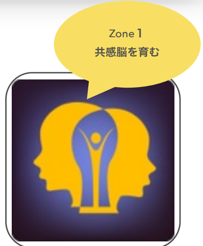
共感脳イメージ図

一方で、「面倒くさいから」「疲れるから」という理由で、時にはコミュニケーションから遠ざかりたくなるのがコミュニケーションの実相です。しかし、どのような理由があったとしても、 コミュニケーションスキルが人生の豊かさに貢献する技能であることは、まぎれもない事実です。